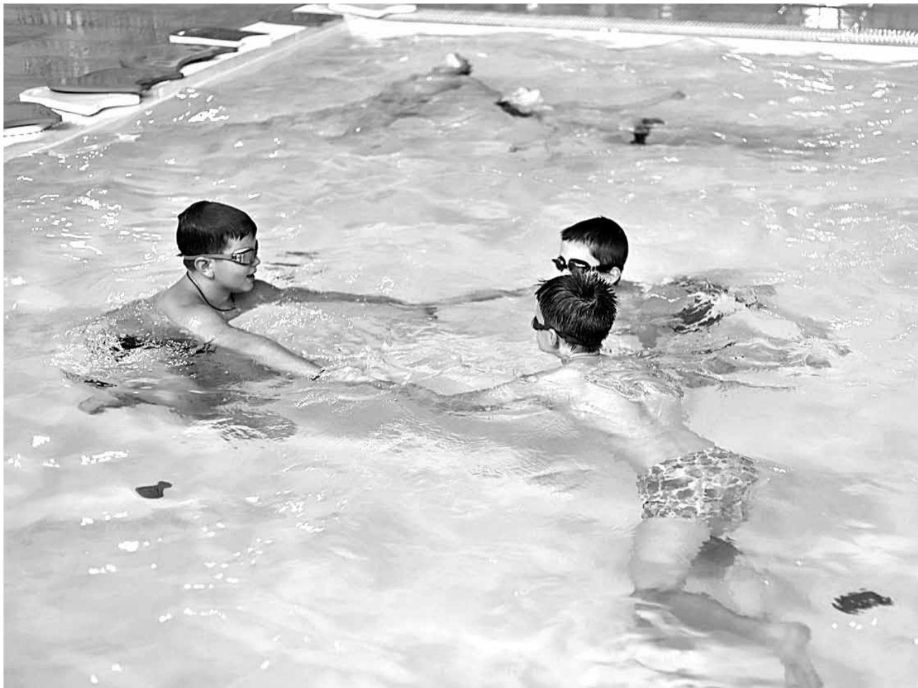
На уроке плавания в школе № 50 г. Белгорода

Ребятам задают вопросы: «Как нужно себя вести, если на реке появились волны?» или «Что нужно делать при плохой погоде на водоёме?» Школьники отвечают, как они всё это видят и знают, а учителя уже корректируют их действия и ответы в соответствии с правилами безопасности. В такой игровой форме проходит начальное обучение.