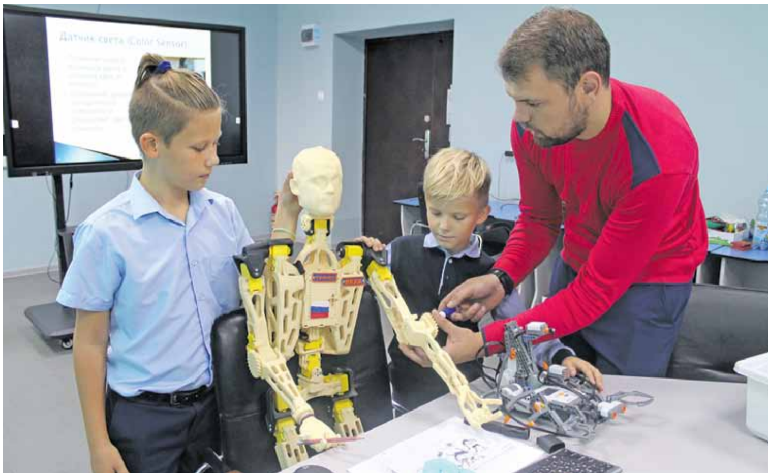
Робот-конструктор, которого головчинские школьники назвали Лёхой, — настоящее учебное пособие

КАК СЕЛЬСКАЯ ГОЛОВЧИНСКАЯ ШКОЛА СТАЛА РЕСУРСНЫМ ЦЕНТРОМ ПО 3D-ТЕХНОЛОГИЯМ