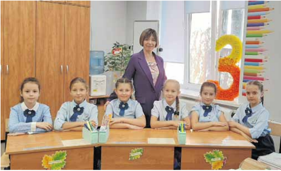
Творческие третьеклассницы — ансамбль жестовой песни «Очаровашки»