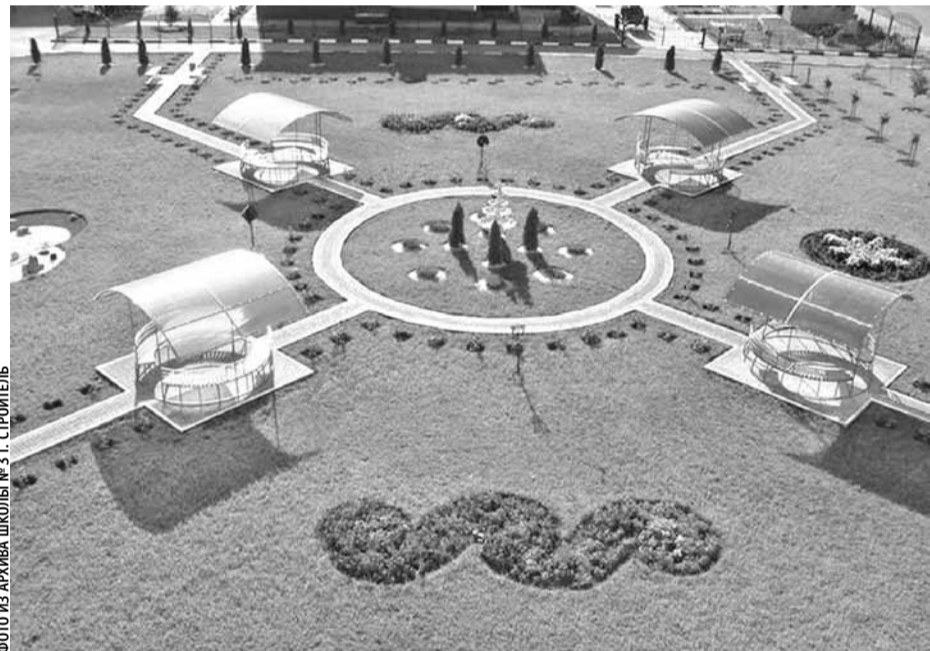
Парк искусств в школе № 3 г. Строитель

Облюбовали Парк искусств и юные художники. — Никакой урок не сравнится с занятиями на свежем воздухе. Что может быть прекраснее, чем выйти на улицу с мольбертом и порисовать? Здесь и солнечно, и яркие краски, и всё так красиво! Отличная разрядка перед тем, как пойти делать