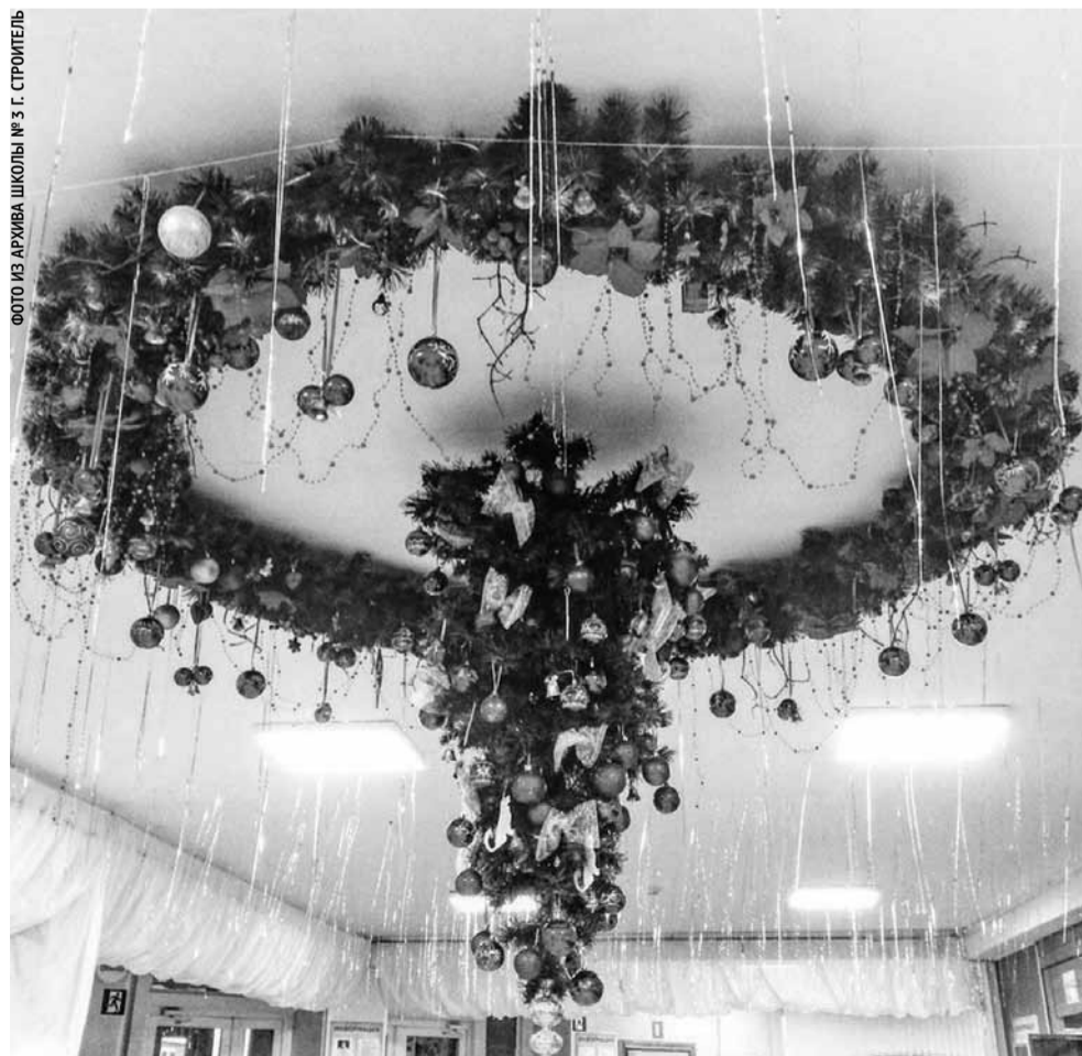
Ёлка вверх тормашками