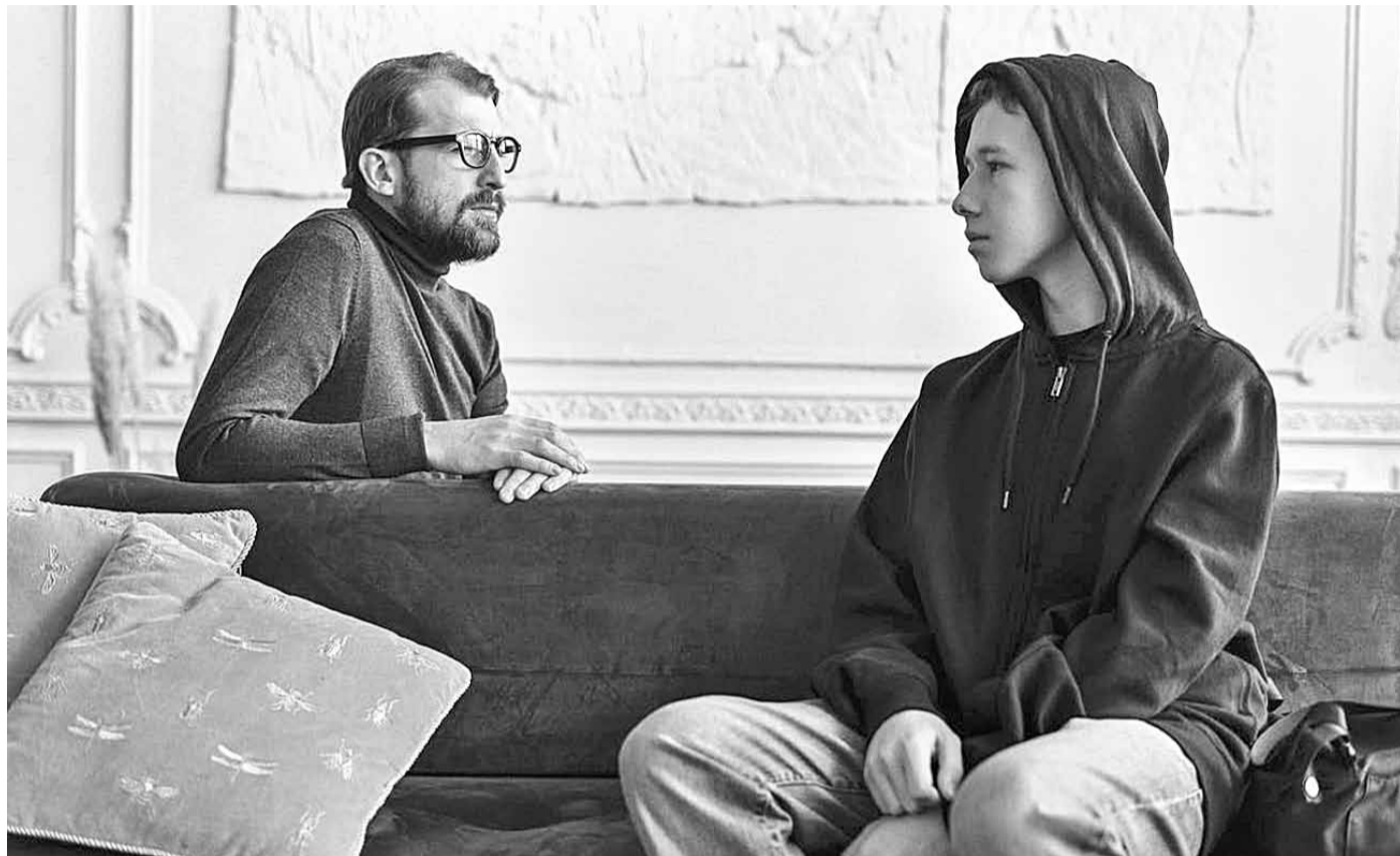
Для подростка очень важно знать, что родители его любят и понимают

ПОЧЕМУ В КАЖДОЙ ШКОЛЕ ДОЛЖНО БЫТЬ ОРГАНИЗОВАНО ПСИХОЛОГО-ПЕДАГОГИЧЕСКОЕ СОПРОВОЖДЕНИЕ