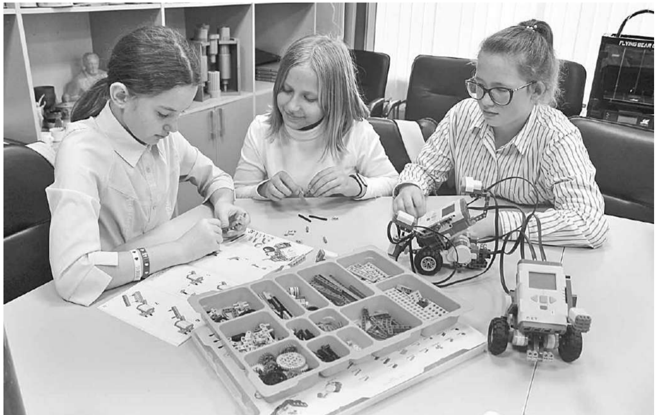
«Робототехника» интересна не только мальчишкам

2016 год. Первые шаги сделаны. Но кого, как говорится, поставить у 3D-руля? Директора? Конечно, не поспоришь, отличный организатор, но острее стоит кадровый вопрос. Это сегодня педа-