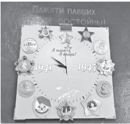
И даже школьные настенные часы сделали с помощью 3D-технологий

15 3D-принтеров, два 3D-сканера, станок лазерной резки, фрезерный станок, четыре квадрокоптера, два комплекта очков виртуальной реальности, ноутбук, 3D-ручки... Откуда в сельской Головчинской школе столько современной техники? В 2019 году открыли «Точку роста». Но это лишь только 3D-оборудования. А остальное?