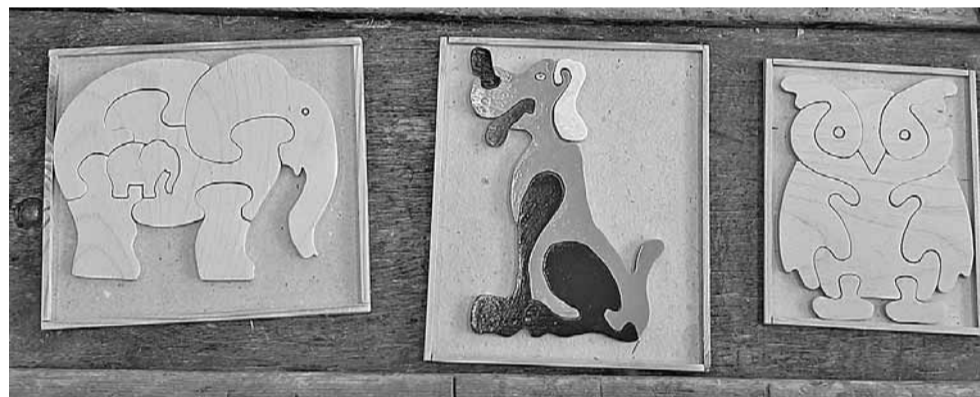
Вот такие деревянные пазлы делают мальчишки на уроках технологии

Сейчас и в колледжах, и в техникумах практически нет специалистов, которые могут учить детей с нарушениями речи, слуха и зрения. И всё же в школе-интернате № 23 находят способы научить ребят полезным профессиональным навыкам.