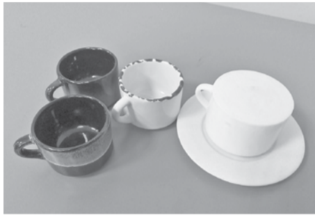
Головчинские школьники разработали мастер-модель кофейной пары для Борисовской фабрики керамики