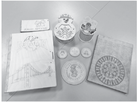
Сувенирная продукция, которую сделали в Головчинской школе