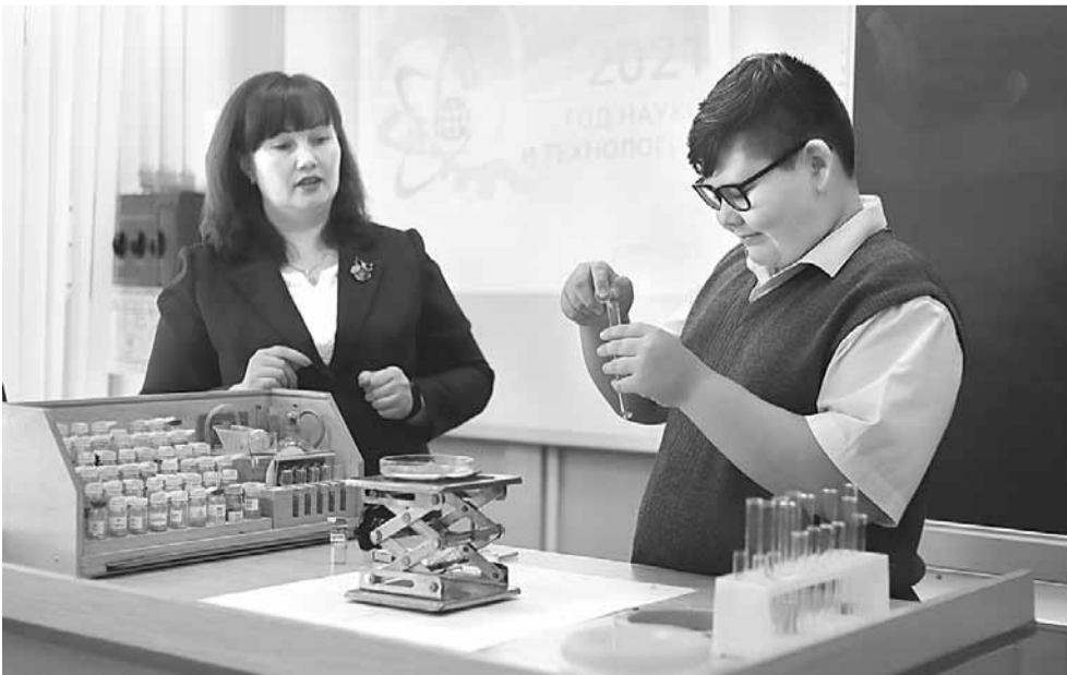
На классном часе «Химический эксперимент и его роль в развитии науки» в 7 «В» классе