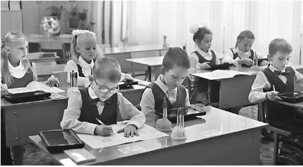
1 «Е» класс на внеурочном занятии «Информатика на платформе «Алгоритмика»