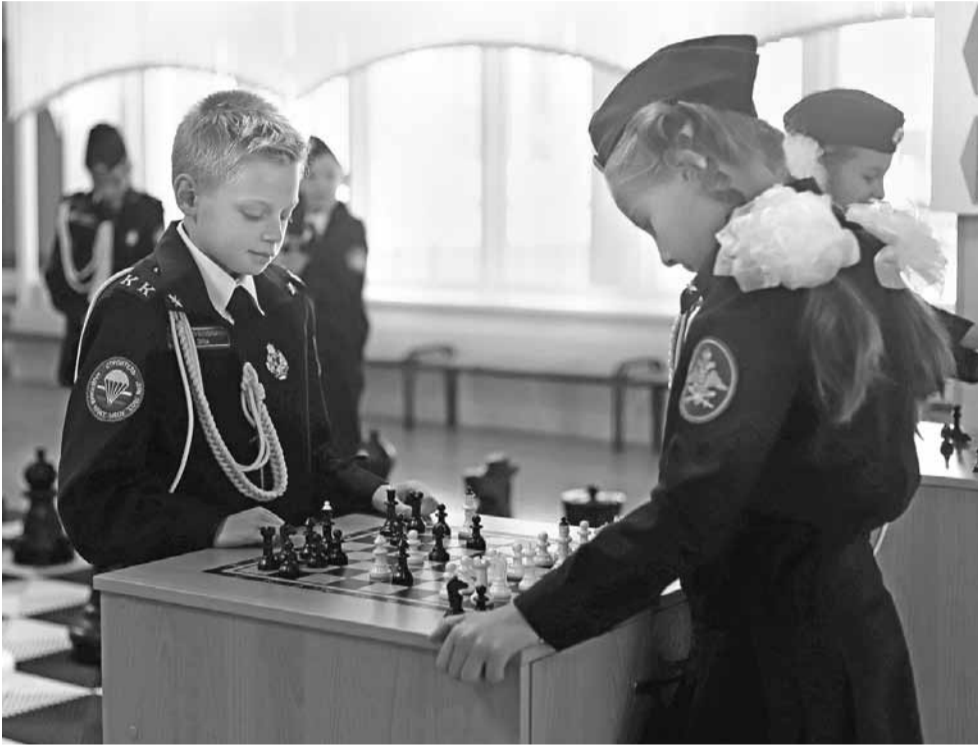
В 4 «В» классе благодаря реализации проекта «Шахматы для всех» все ребята научились играть в шахматы