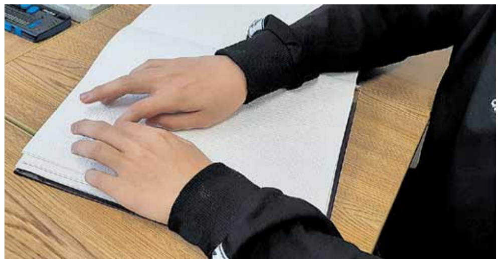
Чтение книги по азбуке Брайля

Сотрудничество с библиотекой удобнее и потому, что невостребованные учебники можно сдать обратно в книжные фонды, пока не появятся ребята, которым эти пособия необходимы, ведь в школе-интернате просто нет места, чтобы хранить много громоздких томов. Иногда присылают учебную литературу во временное пользование из московских издательств или Валуйской школы-интерната для слепых. Или наоборот, в Валуйки едут учебники из Белгорода. Такой взаимобмен выгоден всем. А чтобы ученики не носили тяжёлые портфели, в школе-интернате стараются добыть по два экземпляра учебной литературы — с одним дети занимаются в школе, с другим — дома.