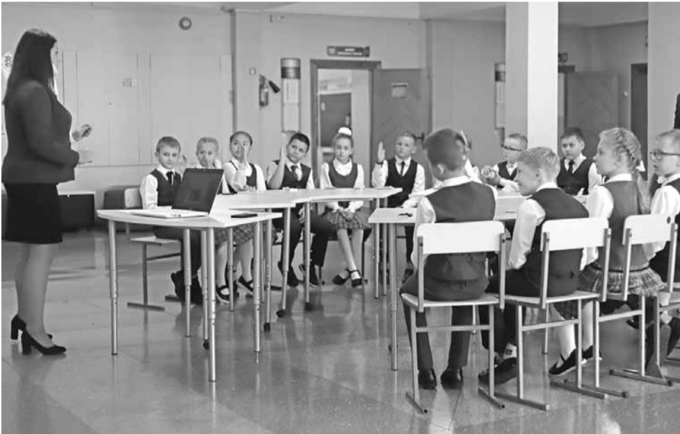
Многие уроки и внеурочные занятия в школе №3 проводят в просторных рекреациях