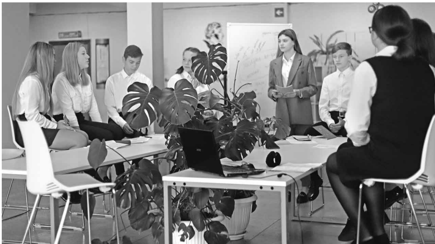
Современное оформление литературной гостиной очень приглянулось старшеклассникам

Директор школы, она же — умелый менеджер, методист, хозяйственник, учитель физики и информатики (преподавание — отдушину любого руко-