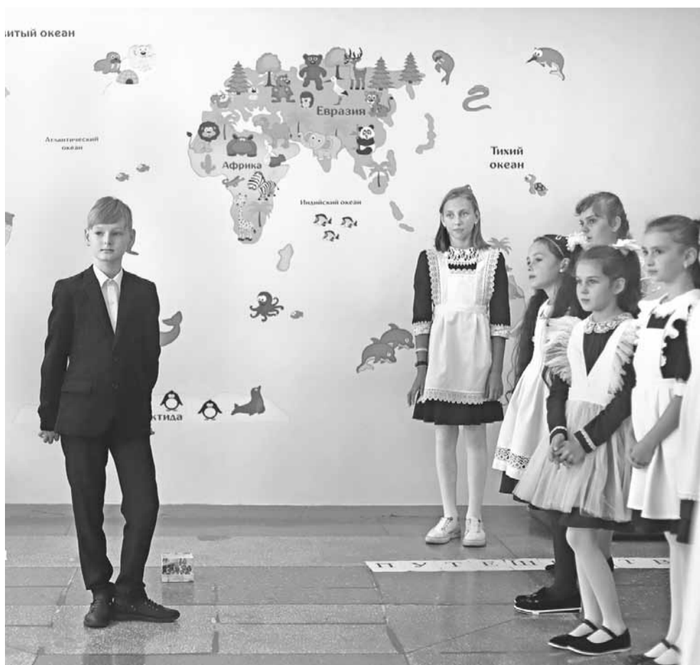
Здорово, когда стены в школе обучающие. В 4 «А» классе провели классный час «Путешествие по морям, океанам, материкам»

— Учителя идут к детям, они должны быть настроены на позитив, нести добро и радость. От того, с каким настроением учитель зашёл в школу,