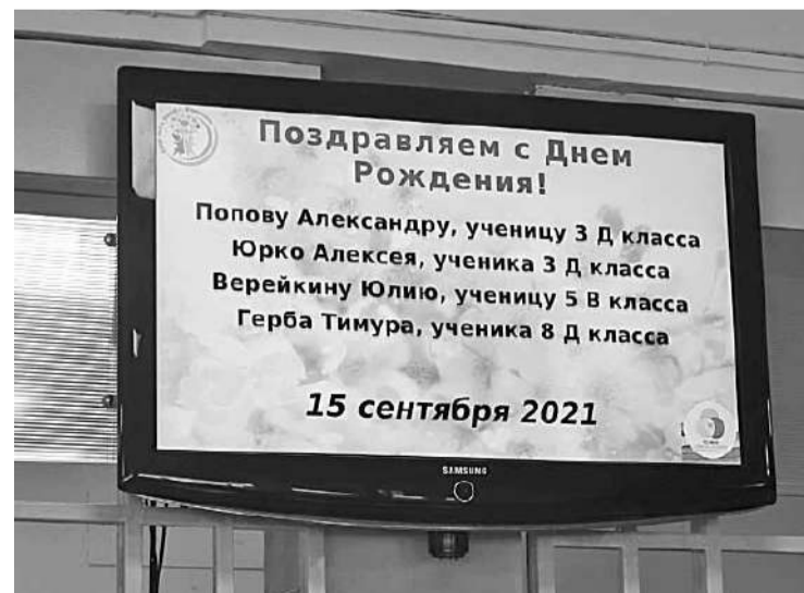
Каждый день именинников — учеников и сотрудников школы — поздравляют с днём рождения