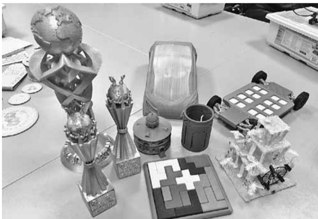
Чего только школьники уже не успели напечатать на 3D-принтере: головоломки, кубки, медали, макет Круглого здания...